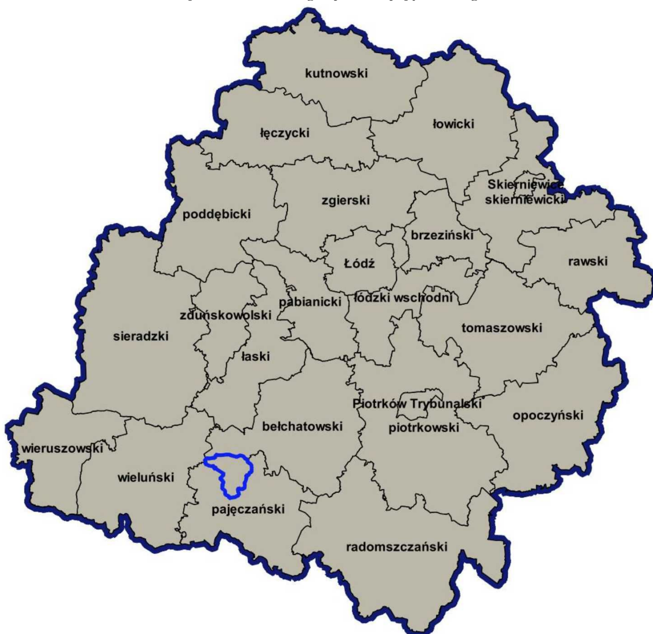
Rys. - Położenie gminy Kielczyglów na tle podziału administracyjnego województwa łódzkiego i powiatu pajęczańskiego